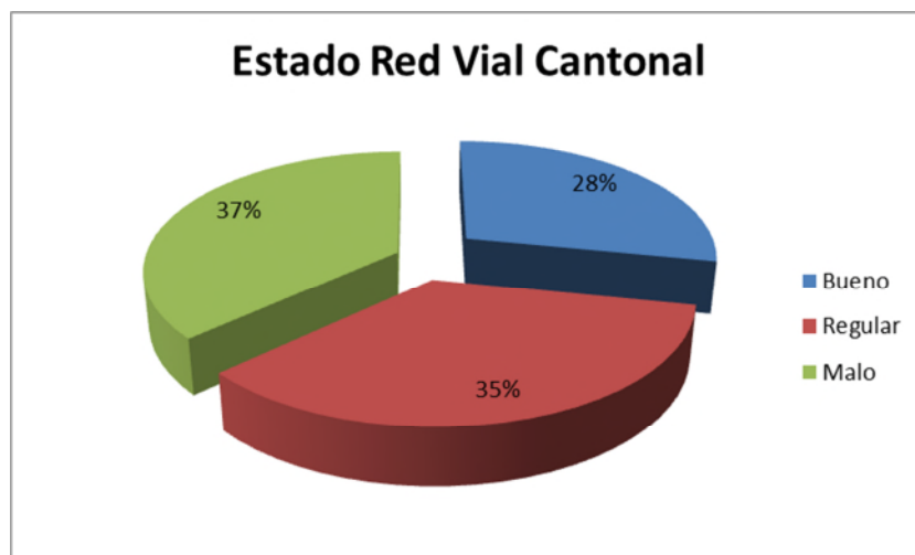
Gráfico N°2. Distribución del estado de la Red Vial Cantonal, año 2017.

Actualmente el departamento no cuenta con un inventario actualizado de puentes ubicados en la red vial cantonal.