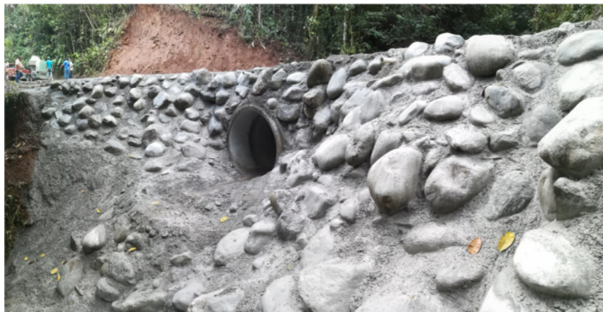
Fotografía N°1: Construcción de paso de tubería en El Silencio de La Suiza.