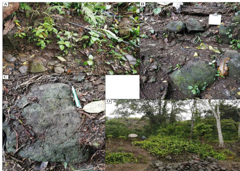
Figura 4. Vista general manantial Los Olivos II. A) y B) Bloques de lava decimétricos compuestos por andesitas basálticas envueltos en una matriz limo arenosa, C) Detalle de los bloques andesíticos; y D) Vista general de la zona de protección actual del manantial.

De manera general en este informe me voy a referir a la fuente únicamente como un manantial de origen ígneo el cual corresponde con acuífero colgado y litológicamente está compuesto por andesitas basálticas fracturadas, con una cobertura de suelo in-situ inferior a los 30 cm (Figura 4).