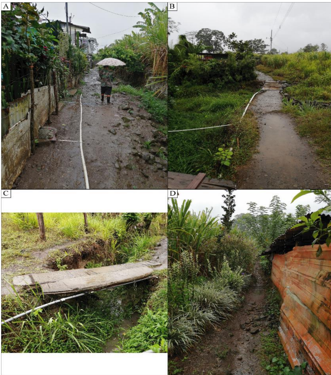
Figura 2. Vista general Sector Norte-Acueducto Los Olivos II.