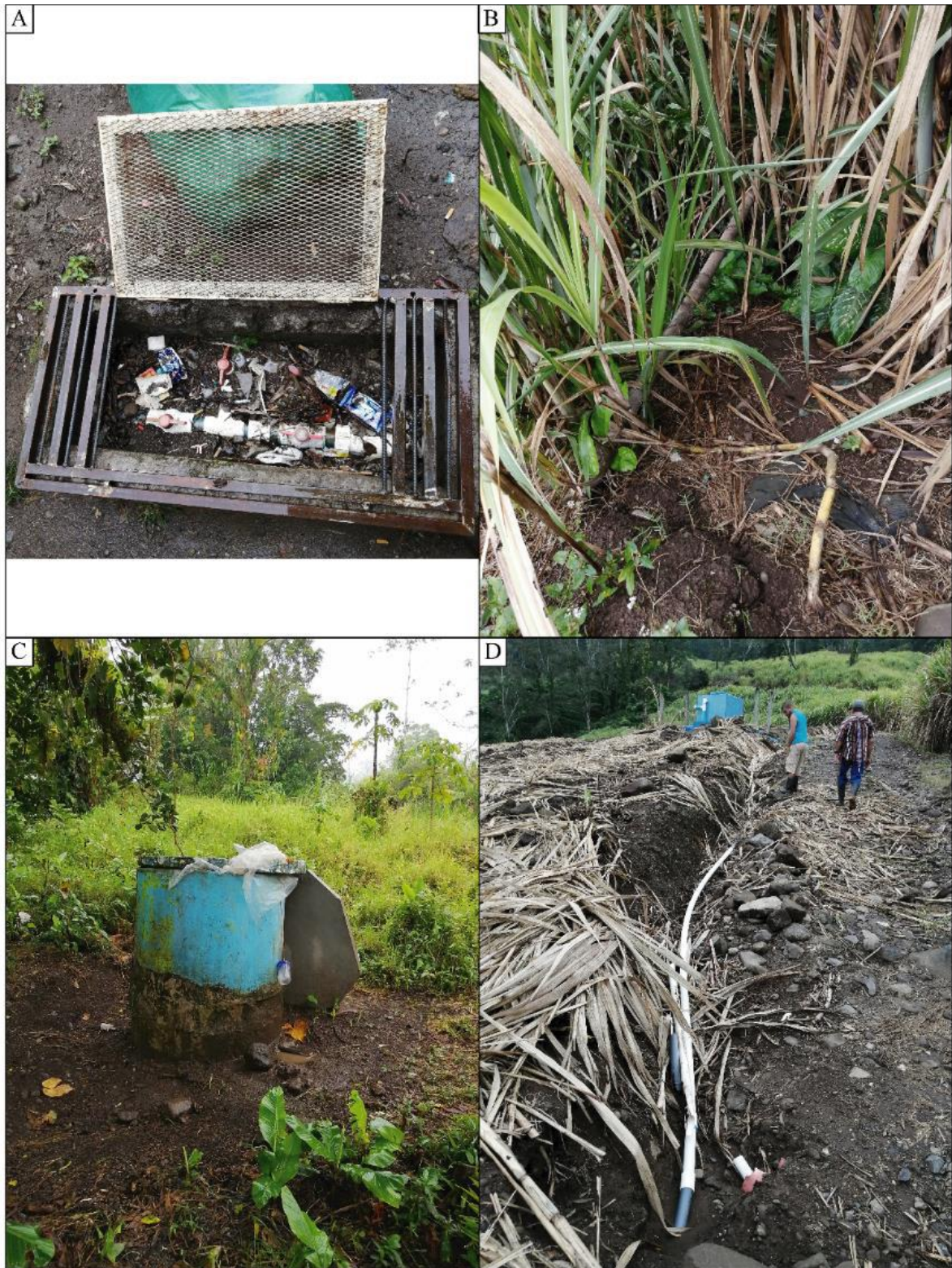
Figura 3. Elementos de la red de conducción. A) Caja de registro unión de la red de conducción con la red de distribución; B) Tramo de la red expuesta, sector de la grúa; C) Tanque quiebra gradiente; y D) Tramo de la red expuesta en un camino de acceso de la Finca.

Al final de la red de conducción existe una caja de registro la cual distribuye el agua por gravedad a los sectores Norte y Sur de la Red. El principal problema que representa esta distribución es que el agua por gravedad fluye hasta el sector más bajo de la red de distribución donde es consumida, provocando que los demás usuarios tengan problemas permanentes de abastecimiento.