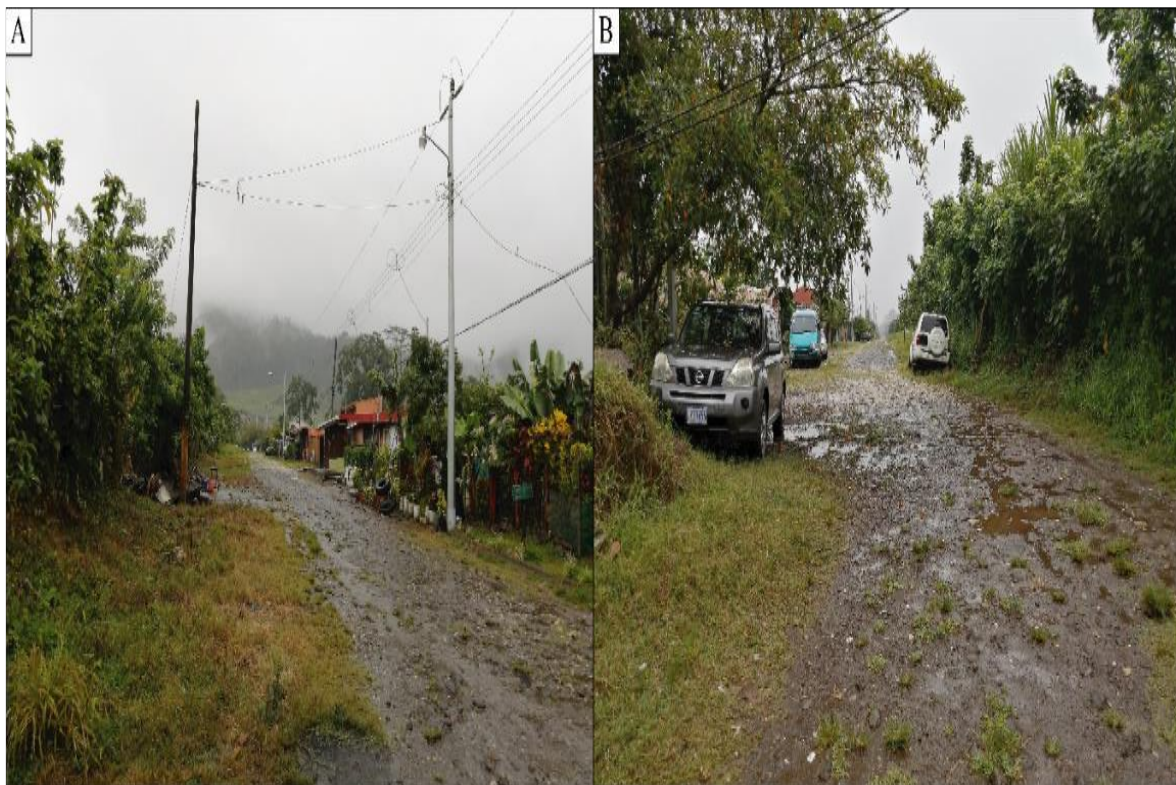
Figura 1. Vista general Sector Sur-Acueducto Los Olivos II.

El sector Norte (Figura 2) está compuesto por aproximadamente 446 m de red. La infraestructura de las casas de habitación es considerada como mala en la mayoría de los casos. El acceso está constituido por un trillo de aproximadamente 1 m de ancho, la red eléctrica de manera general es considerada como regular. La red de distribución se encuentra instalada de manera superficial paralela a las casas de habitación sobre el camino de acceso, en la mayor parte del sector la tubería se encuentra expuesta, lo cual puede ocasionar averías de manera periódica. Además, en este sector existen cuatro puentes en malas condiciones sobre quebradas y/o acequias donde se exponen las tuberías.