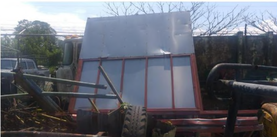
5 . Carreta quebrada