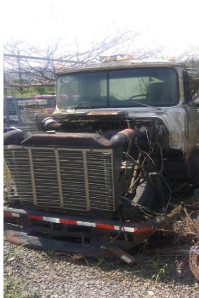
2 . Prensa de camión recolector