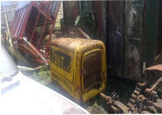
7. Ejes d e camión recolector