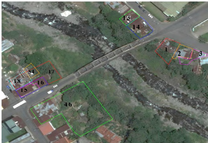
Figura No. 1 Ubicación de lotes indicados en Cuadro No.1

A su vez los consecutivos Nos. 17 y 46 tras el evento del pasado 22 de julio de 2021, son los lotes colindantes al puente actual que presentan mayores variaciones entre linderos actuales, al compararse contra el montaje de los polígonos definidos por los derroteros según plano catastro, ver Figura No. 2.