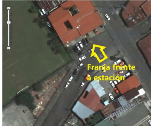
IMAGEN 1: Indicación de sector aparente de interés (no a escala)