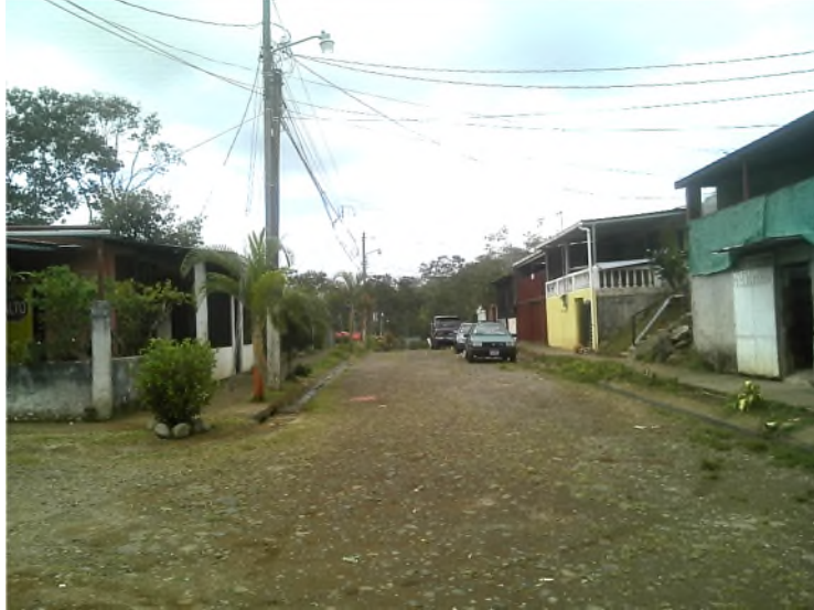
Imagen 4: Vista general de Calle 1 (fotografía de este a oeste)

(c) Calle B: Se observó en lastre y acabados como las anteriores. En la imagen 5 se muestra vista de sur a norte desde la calle 1.