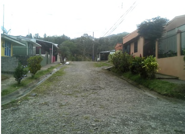
Imagen 5: Vista general de Calle B (fotografía de sur a norte)

(c) Calle B: Se observó en lastre y acabados como las anteriores. En la imagen 5 se muestra vista de sur a norte desde la calle 1.