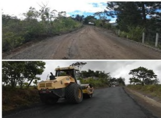
Fotografía N°1: Pendiente estabilizada camino público 03-05-014 La Selva – Las Colonias.