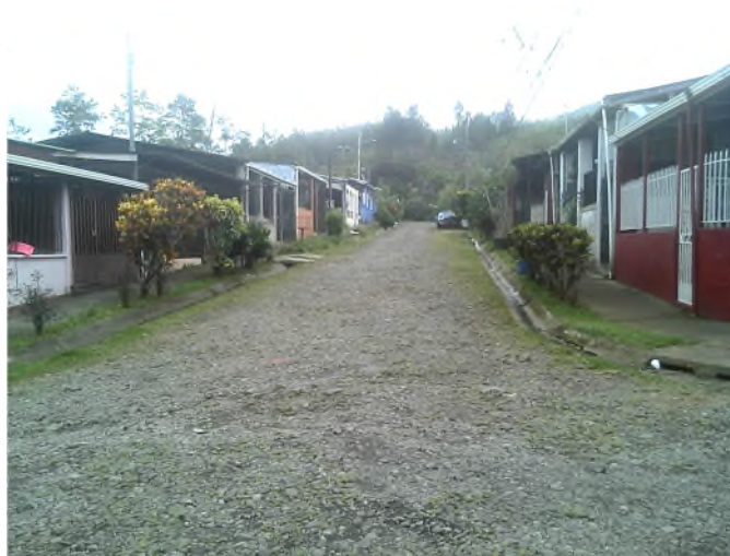
Imagen 2: Vista general de Calle A desde calle 1 (fotografía de sur a norte)

(b) Calle 1: Se observó en lastre y con mismos acabados que la calle A. En la imagen 3 se muestra vista de oeste a este y en la imagen 4 se muestra en sentido este a oeste.