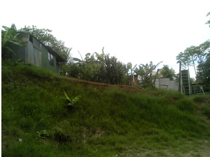
Imagen 10: Vista detalle de milpa vista en sector y aparentemente dentro del lote