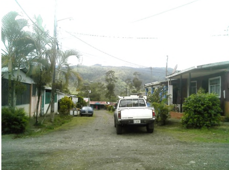
Imagen 1: Vista general de Calle A desde ruta nacional 413 (fotografía de norte a sur)