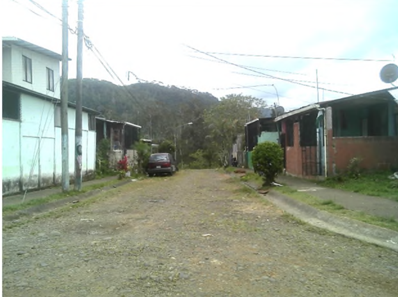
Imagen 6: Vista general de Calle 2 desde calle B (fotografía de oeste a este)