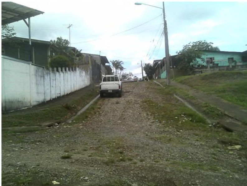
Imagen 7: Vista general de Calle 2 (fotografía de este a oeste)