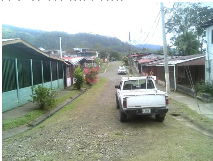
Imagen 3: Vista general de Calle 1 (fotografía de oeste a este)

(b) Calle 1: Se observó en lastre y con mismos acabados que la calle A. En la imagen 3 se muestra vista de oeste a este y en la imagen 4 se muestra en sentido este a oeste.