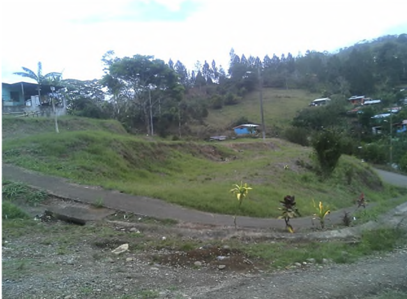
Imagen 8: Vista general de área comunal y de juegos infantiles desde el sector este del lote (fotografía de sureste a noroeste)