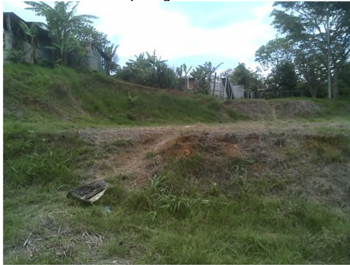
Imagen 9: Vista detalle de área comunal y de juegos infantiles desde el sector noreste del lote (fotografía de noreste a suroeste)