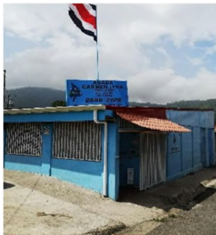
Fotografía 1 Oficinas de la Asada Carmen Lyra.