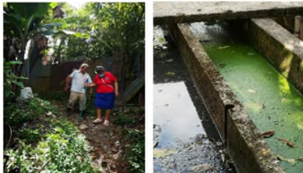
Fotografías 4 y 5. Visita al sitio de la PTAR y verificación de su condición actual

La PTAR fue construida prácticamente dentro del cauce del río Aquiares. Los señores de la Asada informaron que producto de las crecidas del río, las aguas inundan todo el sector en el que se ubica la planta.