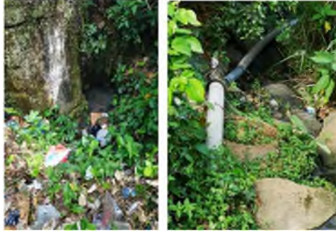
Fotografías 7 y 8. Visita a la red de alcantarillado de la Asada Carmen Lyra

v. Con respecto al sitio en el que se ubica la PTAR: