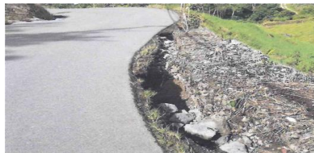
IMAGEN DE LAS CONDICIONES DE LA ZANJA