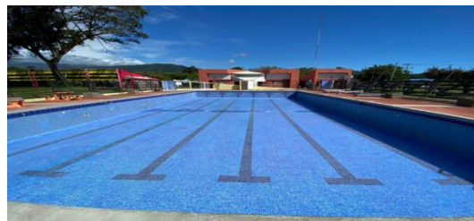
Imagen #3: Piscina principal entregada a satisfacción, fraguada al 100%.