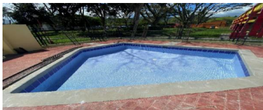
Imagen #9: piscina de niños intacta