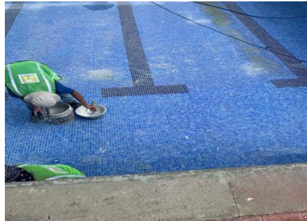
Imagen #8: Dentro del círculo amarillo se evidencia el cemento gris desprendido.