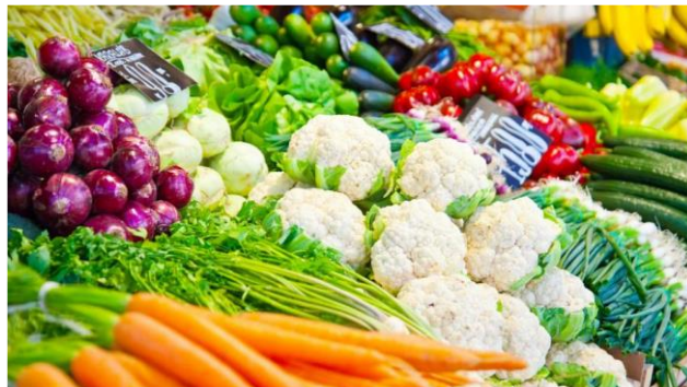
Eje de la Política 2: Fomento de la Competitividad