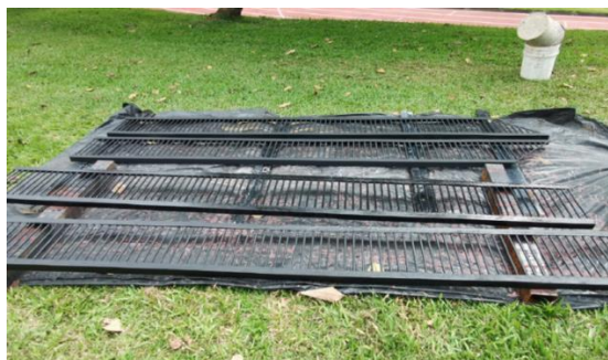
Imagen #7: Parrillas en perfecto estado al entregar