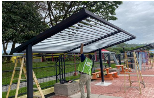
Imagen #6: evidencia de los postes en excelente estado al entregarse la obra.