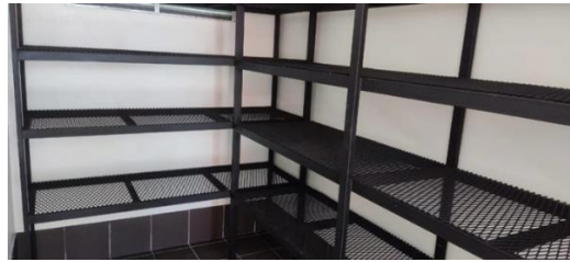
Imagen #4: Mueble en metal de bodega de químicos