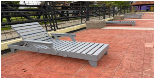
Imagen #5: sillas de madera entradas a satisfacción.

Estas bancas se exponen al sol diariamente sin ningún resguardo.