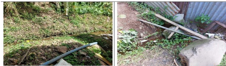
Figura 1 Se observan flujos de agua constante alrededor de la vivienda.

D. El piso y las paredes de la vivienda muestran daños asociados a humedad.