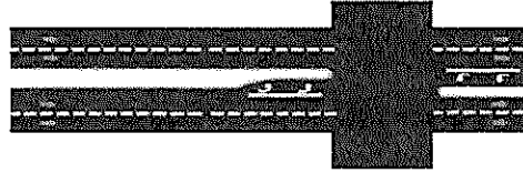
b. Marcas típicas en carreteras divididas por una isla Aplicación de líneas de carril Figura 3.5

El ancho de carril conveniente en carreteras rurales no debe ser menor de 3.00 m, aunque lo deseable es que sea de 3.65 m de ancho.