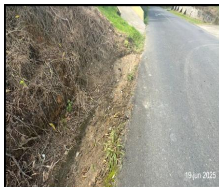
Imagen No.3. Cunetas y alcantarilla obstruidas.

13 Se menciona inconformidad por la limpieza realizada durante las labores de conformación, 14 al momento realizar la inspección no se encuentra ninguna afectación, ya que los vecinos 15 indicaron que ellos removieron el material acumulado en los puntos mencionados, 16 analizando la situación pudo tratarse de pequeños montículos que quedaron durante la 17 conformación ya que fue material apilado por partes para que luego se realizara la 18 respectiva recolección con equipo especial (back hoe) el cual no dejo bien detallado el 19 mencionado punto de recolección y esto afecto el libre flujo de la escorrentía. Sin embargo, 20 al realizar la inspección se observó que existe un tramo de cuneta revestida y alcantarilla 21 longitudinal que se encuentran completamente obstruidas por sedimentos provenientes de 22 un antiguo deslizamiento en este lugar, afectando directamente el buen funcionamiento del 23 sistema de drenaje pluvial. (ver imagen 3)