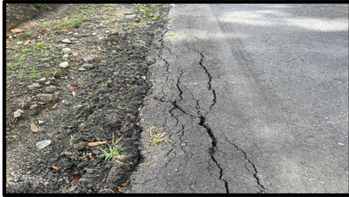
Imagen No.2. Daño al pavimento.

1 riesgo ya que en ninguno de los puntos compromete gravemente la estabilidad de la 2 calzada, pero si se considera importante realizar una reparación para controlar el 3 agrietamiento ocasionado y que este no crezca en el futuro. (ver imagen 2)