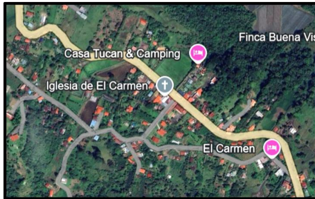
12 Imagen No.1. Sector el Carmen, Rn.230 SC 30652.

2 Realizar una inspección para valorar el estado de los trabajos ejecutados recientemente en 3 el lugar de la ruta nacional 230 SC 30652, entre los estacionamientos 27+750 y 29+450, 4 según la siguiente ubicación: