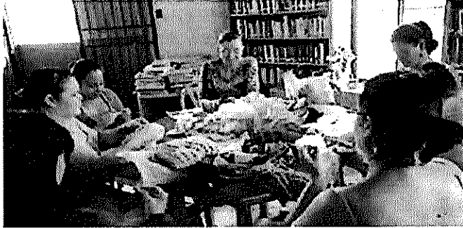
Mujeres líderes de la comunidad se capacitan

19 Reg. Octavio Arce Obando – Presidente Municipal: Para nosotros es un placer tenerlos 20 por acá e igualmente que conozcan la dinámica que vivimos aquí todas las semanas, en estos 21 días es un poquito diferente y a veces nos pasamos en la parte sociable porque estamos 22 viviendo fechas muy importantes, pero lo importante es el desarrollo del cantón y con temas 23 como este vamos desarrollando poco a poco en los diferentes distritos. -----