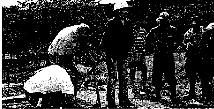
Colocación de la primera piedra noviembre del 2006