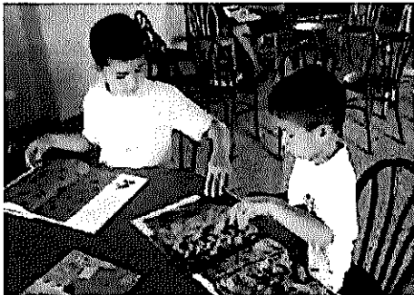
17 Niños nos visitan con frecuencia