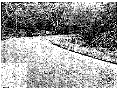
Fotografía No.3: Inexistencia de barreras de protección vehicular.