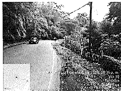
Fotografía No.2: Condición actual de la vía, sección inspeccionada.