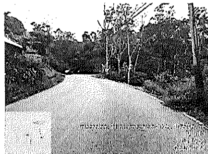
Fotografía No.4: Condición de la Ruta Nacional No.10.